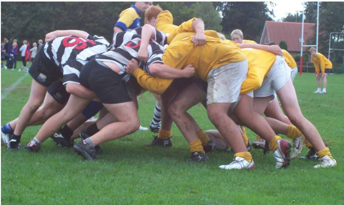
Ungdomsstævne i Holstebro

Superligaen er færdigspillet og Speed nåede ikke at prøve at vinde. Efteråret bød ellers på fremgang og målsætningen om at forbedre resultaterne fra foråret blev indfriet helt til den sidste kamp i Erritsø som blev tabt meget stort. Århus vinder guld ved at spille uafgjort 3-3 i den sidste kamp mod FRK.