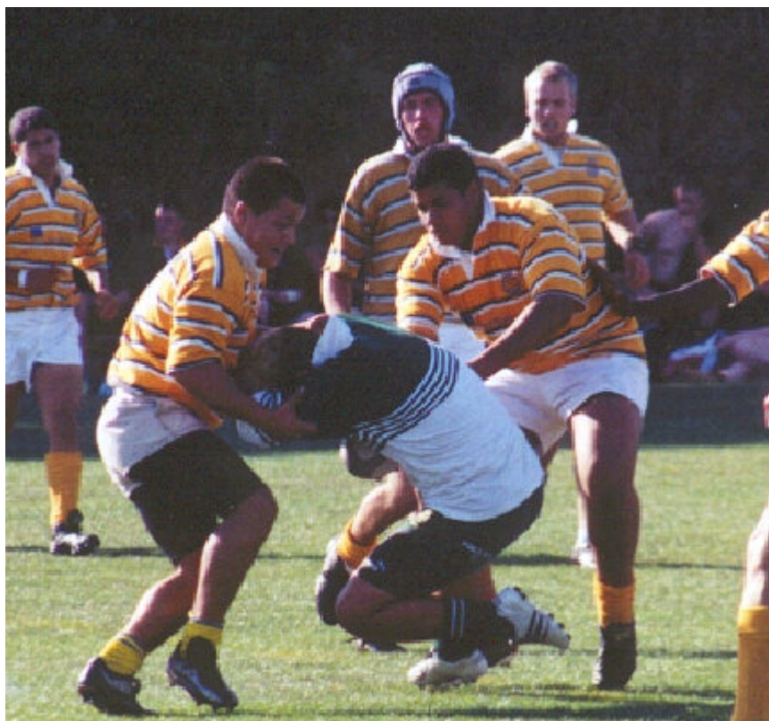
Fra Englandsturen: Speed U17-Basildon