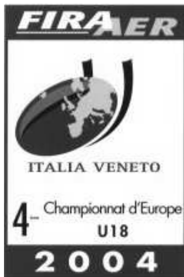
Logo for U18 EM