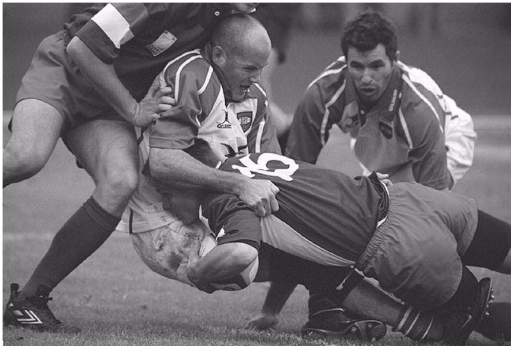
Billede fra Danmark-Slovenien

Nytårskur afholdes den anden weekend i januar