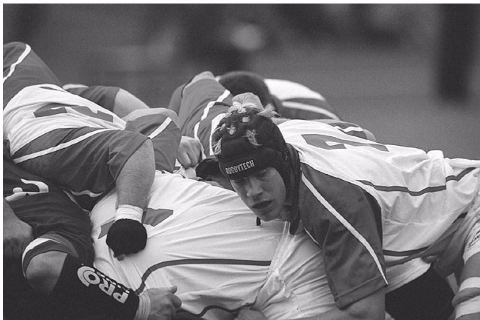
Billede fra Danmark-Slovenien

Køges næstbedste fodboldhold vil den 22. november prøve om de kan hamle op med Speeds ungdom inden for rugbysporten. Det sker når holdet denne dag møder op hos Speed og bliver instrueret i spillet med den ovale bold.