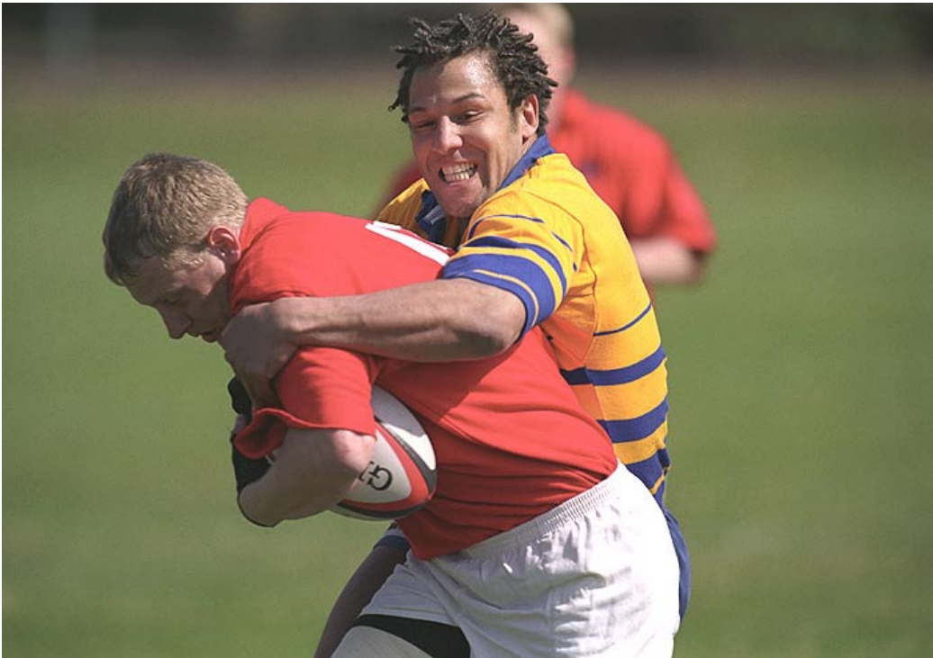
Billeder fra Sverige-Danmark.