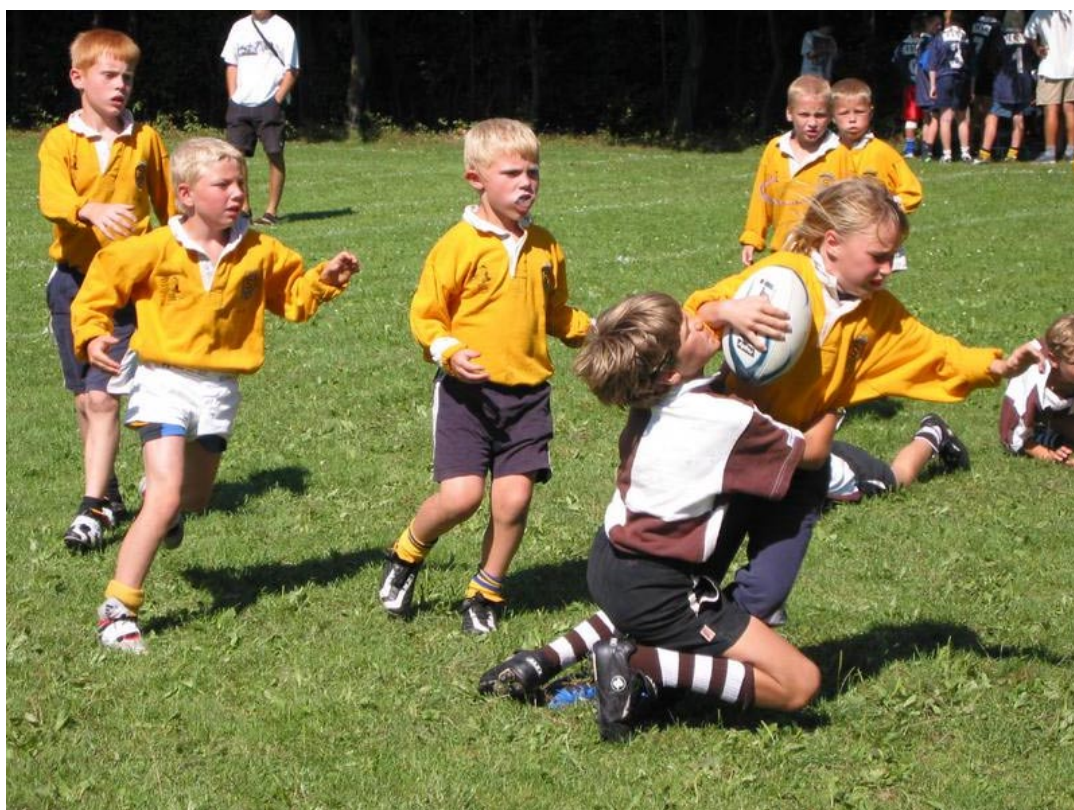
Pingvin Cup 2002