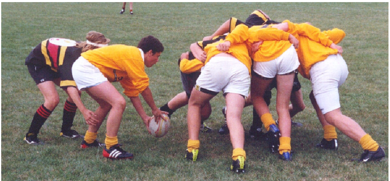
Speed U15 mod Malmø

"De unge mod de gamle" eller "De hvide mod de gule"