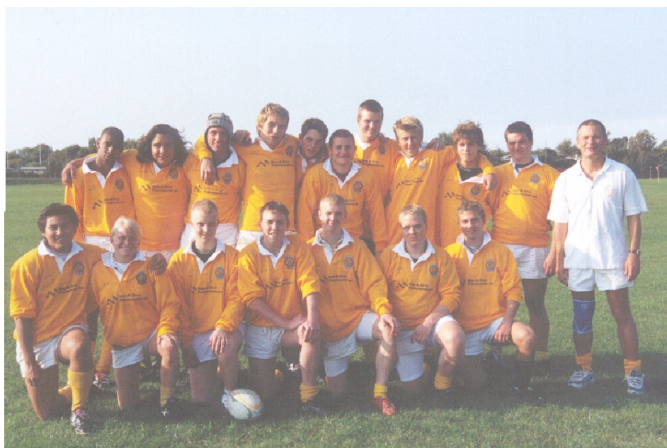
U17 ved DM