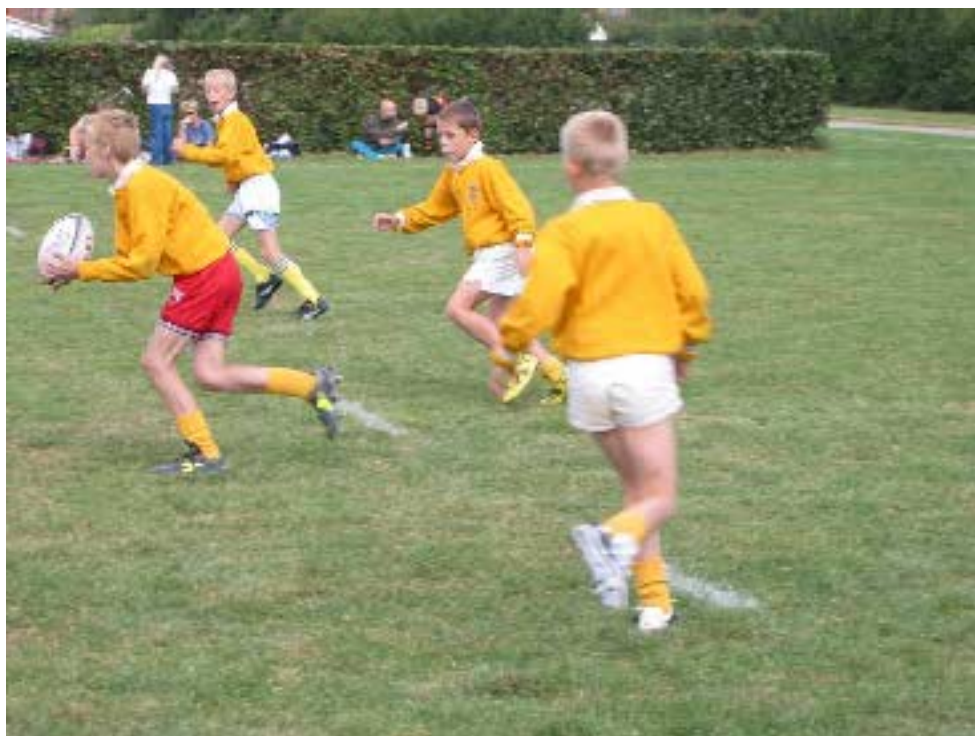
Øresundsstævne hos Speed