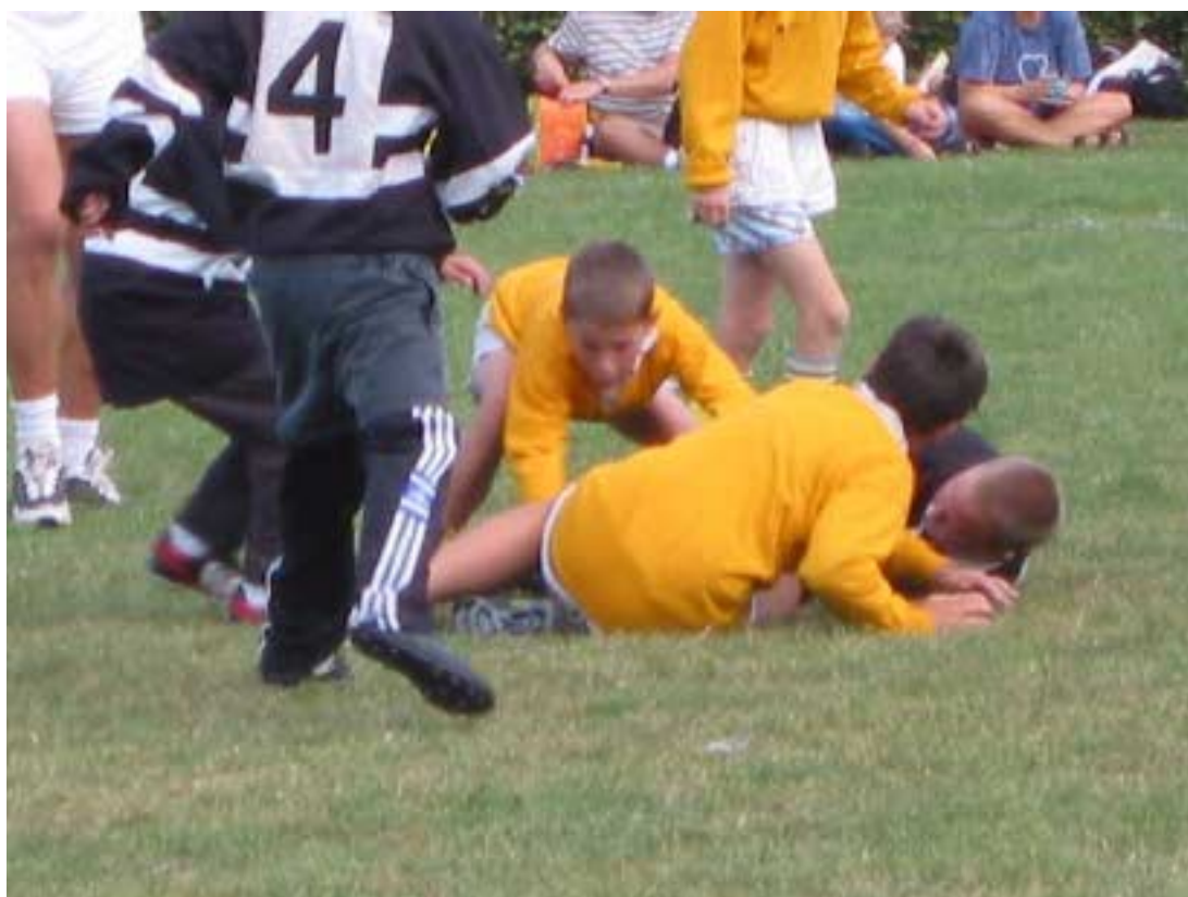
Øresundsstævne hos Speed

Samme weekend blev der også spillet i de andre FIRA-divisioner. I division 3C finder man Norge, som rejste til Bulgarien. På grund af begrænsede midler i den norske union og begrænset rejsestøtte fra FIRA måtte hver af de 19 norske spillere betale en del af rejseomkostninger samt ophold i Bulgarien. Ikke nok med det, men alt var åbenbart imod nordmændene. En schweizer skulle dømme kampen, men han fik ikke lov at rejse ind i Bulgarien. Derfor overtog en lokal fløjten. Denne kunne ikke et ord engelsk og da resultatet blev 11-3 til bulgarerne bliver formentlig nedlagt protest fra nordmændenes side.