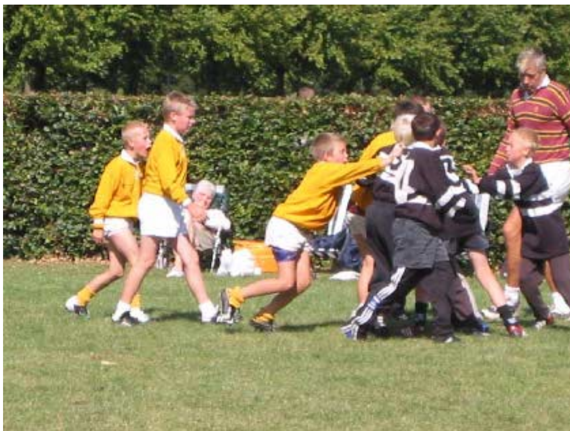
Øresundsstævne hos Speed

Uden for Europa er der også omspil i gang. Noget overraskende vandt Papua New Guinea samlet over Cook Islands. Der venter to kvalifikationsrunder mere her. Først Tonga og vinderen af denne spiller mod Sydkorea om endelig kvalifikation.