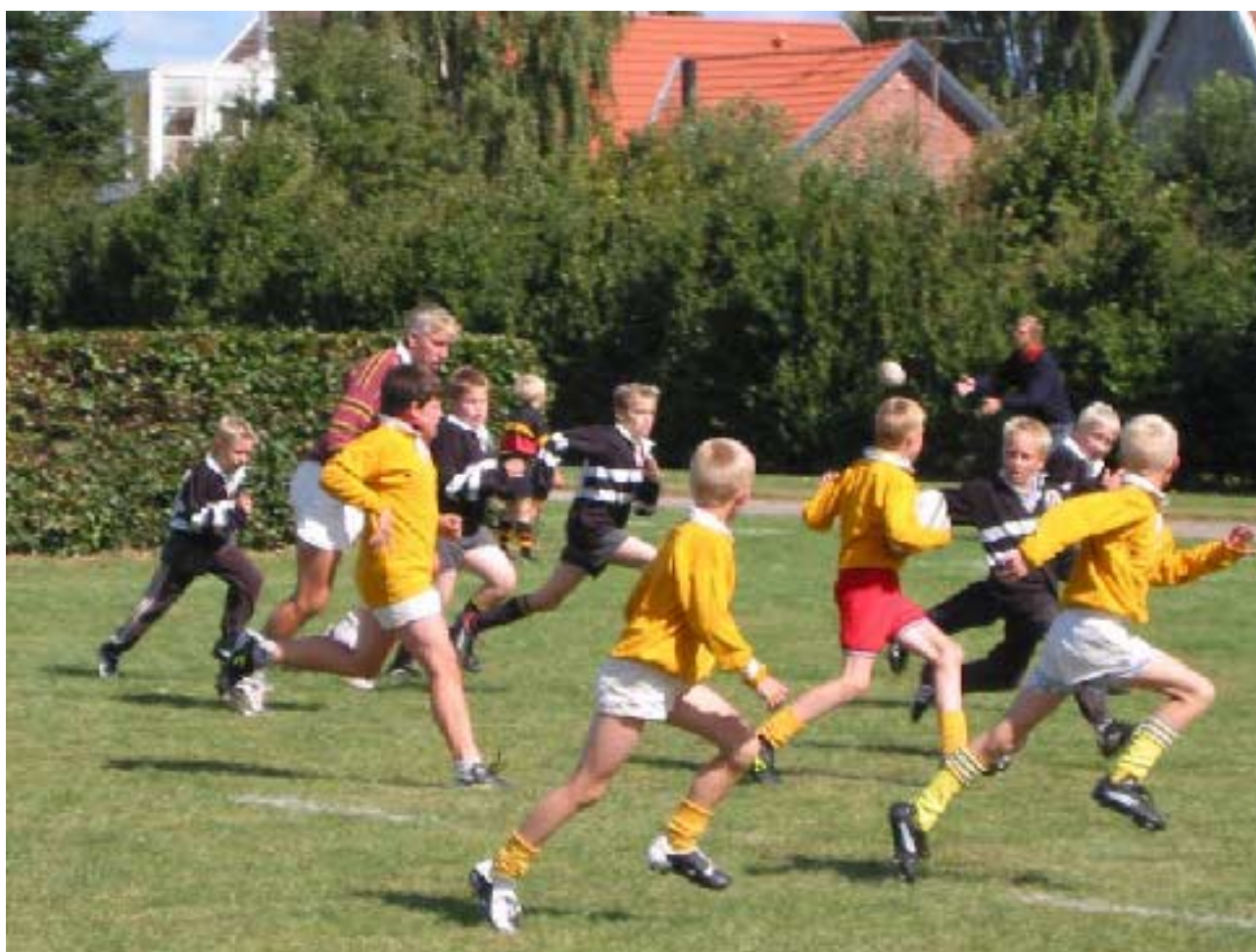
Øresundsstævne hos Speed

Fra ungdomsafdelingen skal der lyde en stor tak til de forældre, venner og andre, der mødte op og støttede ungerne, og ikke mindst en stor tak til de forældre og spillere, der tog slæbet i baren og klubhuset, uden jer var dagen ikke gået så godt som den gjorde. Tak for hjælpen.