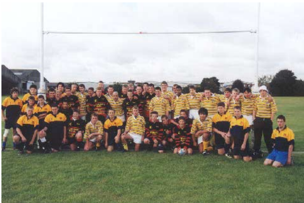
Spillerne fra Speed U15-U16 og Chippy U15/Oxford U15 under Englandsturen