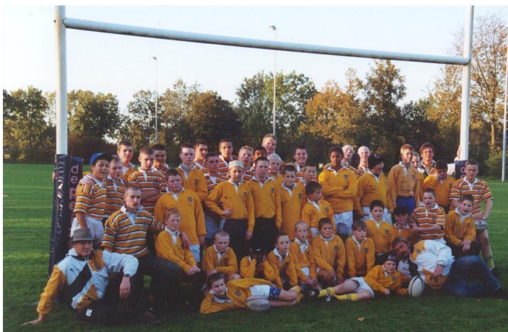
Ungdomsholdene i Holland