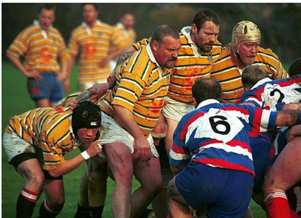
En sejrende førsterække.

Eventuelle forslag skal være bestyrelsen i hænde senest fredag d. 12/1-2001.