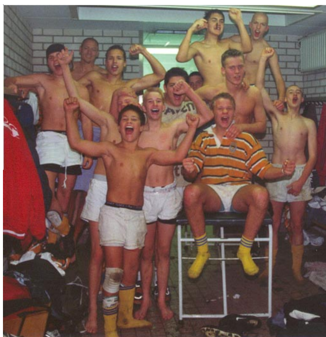
Glæde over en af sejrene i Holland.