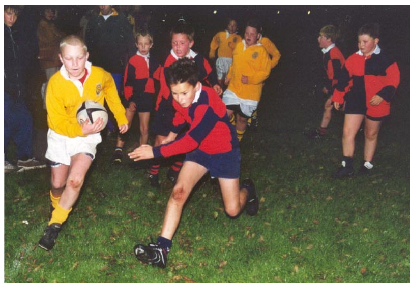
U15 i Holland mod Almere