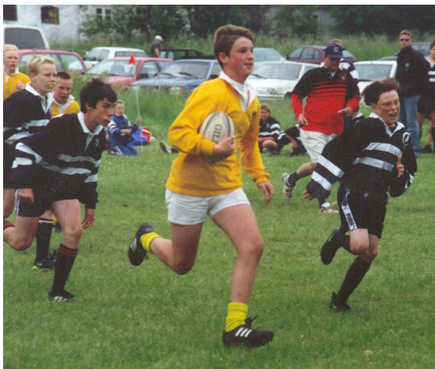
U13 i Hundested Cup mod Pingvin